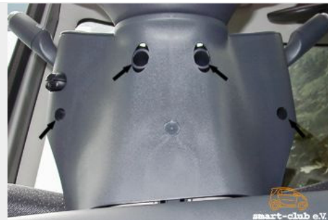
Die Lenksäulenverkleidung von unten mit den Schraubenlöchern

Das Kombiinstrument wird dann einfach nach oben abgehoben, dabei evtl. etwas Richtung Lenkrad ziehen, da es dort eingerastet ist.