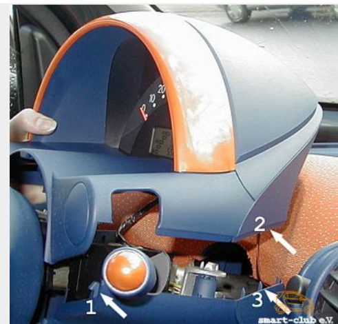
Kombi wieder einbauen

Am besten Kombi von oben leicht schräg einsetzen, damit es in die Haken 1 eingesetzt werden kann. Dann den Rest aufsetzen und dabei darauf achten, daß die Überlappung 2 zwischen die Führungsnasen 3 und die Verkleidung greift. Nun gilt es nur noch, die vier Schrauben wieder einzudrehen und Du bist mit der kleinen Bastelei fertig!