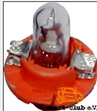
Ersatzlämpchen Osram 12 V 1,1 W

Ist ein Lämpchen der Tachobeleuchtung oder eine Kontrollampe in Deinem smart ausgefallen, dann kannst Du Dir so helfen: An Werkzeug solltest Du einen 10er Torx-Schraubendreher (mind. 80mm Klingenlänge) zur Verfügung haben - und natürlich die erforderlichen Ersatzlämpchen. Diese bekommst Du im smart Center oder beim Autozubehörhandel. Der Zeitaufwand beträgt etwa 10 bis 15 Minuten. Die nötigen Lämpchen für Skala und Kontrollleuchten sind Osram 12V 1,1 W für smart aller Baujahre.