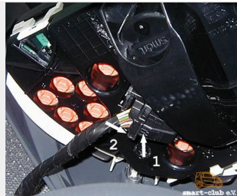
Stecker des Kombiinstrumentenkabels

Um diesen Stecker abziehen zu können, muss zuerst die Rastnase (1) eingedrückt und gehalten werden, dann der Verriegelungshebel (2) in Pfeilrichtung geschoben werden. Wenn der Hebel um 90 Grad gekippt wurde, kann man den Stecker ganz einfach abziehen.